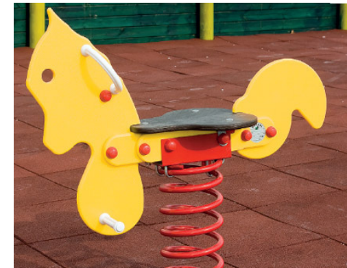
N°1 Pony a molla dim.102 x 36 x h93