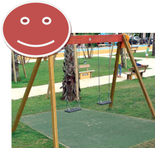
N°1 Altalena Lamellare dim. 385x191x238h