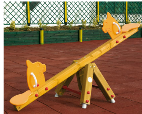
N°1 Bilico Ali dim. 200x70xh90